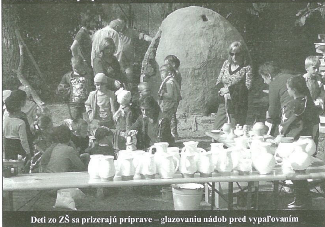
Deti zo ZŠ sa prizerajú príprave – glazovaniu nádob pred vypaľovaním

Ďalší deň – v sobotu, 1. októbra 2016, v programe Duša hliny predstavili verejnosti výnimočne zachovaný hrnčiarsky folklór miestne folklórne skupiny Harčarkí, Harčarik a Harčare.