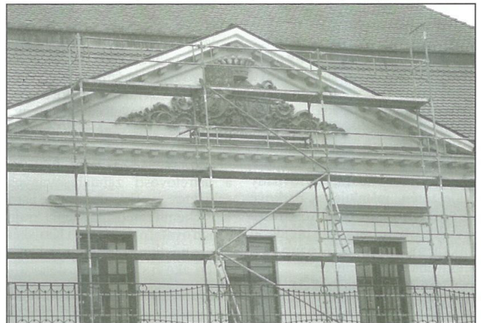
Reštaurovanie tympanónu a združeného erbu rodín Sztáray a Batthyány

Hlavný cieľ rekonštrukcie pôvodného barokovo-klasicistického kaštieľa šľachtickej rodiny Sztárayovcov predstavovalo zvýšenie kultúrno-spoločenského potenciálu využitia múzea a zlepšenie kvality poskytovaných služieb. Súčasťou projektu bolo tiež vybavenie časti interiéru historickými replikami, kreslami, stolčekmi a rôznymi inými doplnkami.