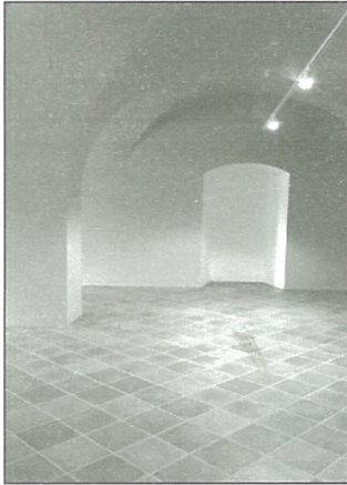
Budúca expozícia sakrálneho umenia