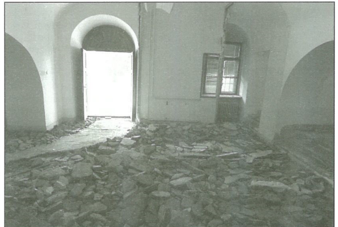
Búracie práce na prvom nadzemnom podlaží – hlavný vstup do kaštieľa

Objekt bol pred obnovou v nevyhovujúcom technickom stave a niektoré priestory sa už nedali využívať vhodným spôsobom.