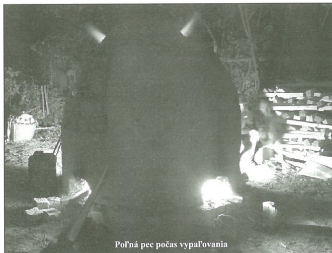
Poľná pec počas vypaľovania