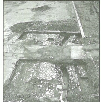
Objekty kamennej architektúry na severnej strane námestia