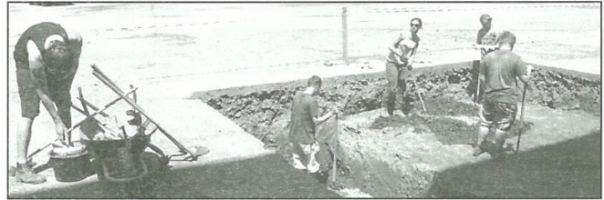
Archeologický výskum v juhovýchodnej časti Kostolného námestia

Následne bola preskúmaná – opäť formou vyhlbenia dvoch sond – juhovýchodná strana námestia, pričom sa tam podarilo objaviť nálezy podobného charakteru.